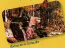
Rocher de la Grenouille

Au Looththal, traverser la D134 et suivre □ (direction Ingwiller). Au parking, poursuivre en direction de La Petite-Pierre. Traverser la D7, monter au rocher de la Grenouille puis continuer jusqu'à La Petite-Pierre. Descendre la rue du Kirchberg puis remonter la rue principale en direction de la vieille ville pour rejoindre le parking.