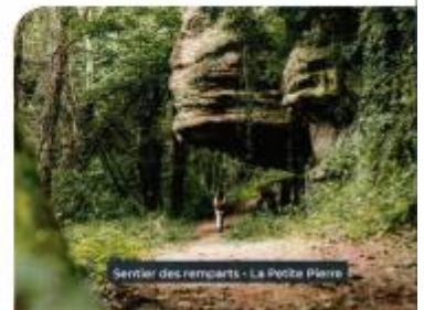
Sentier des remparts - La Petite Pierre

Circuit du Hamberg - 10 km | 2h45 Belle balade entre champs et prairies avec vue sur les contreforts vosgiens et le village de Schillersdorf. Départ : au niveau du n°74 rue de Hanau-Lichtenberg à Zutzendorf Balisage : anneau vert