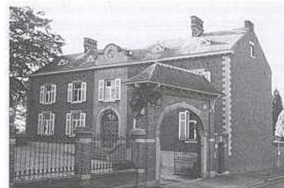
Le manoir Hardy