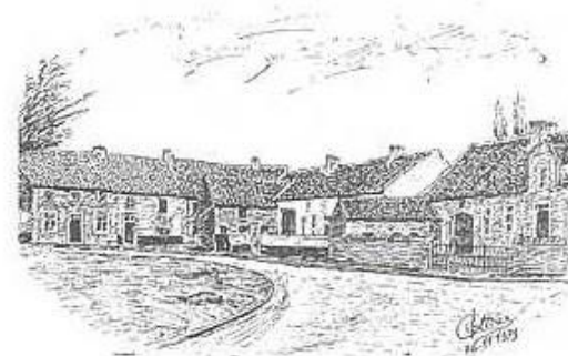
La place de Thisnes au début du 19 e siècle.

Jadis quasiment la seule source de revenus, l'agriculture n'est plus aujourd'hui que l'affaire de quelques fermiers. Il y avait une sucrerie à Thisnes, elle a fermé ses portes en 1900. La plupart des Thisnois sont navetteurs. A noter toutefois la présence de quelques commerces de détail et d'autres indépendants, et celle de plusieurs entreprises de matériel agricole. Récemment, un poulailler industriel s'est implanté le long de la rue de Wavre.