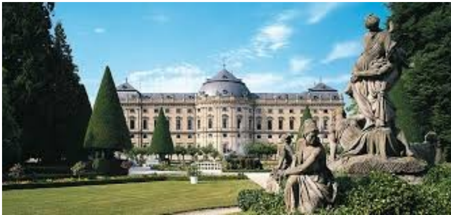
La résidence à Würzburg .

Nous logerons dans la vallée de la Tauber : une belle région viticole , où le cépage Sylvaner est le roi du vin !