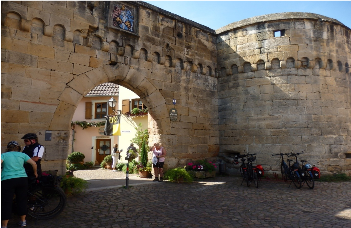
Porte d'entrée médiévale à Freinsheim .

champs, vergers, vignobles et une réserve paysagère .Distance ± 8,5 km .