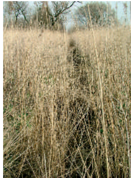
Sources de l'Orne à Corroy-le-Château