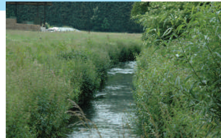
L'Orne à l'entrée de Court-Saint-Étienne

Le parcours de l'Orne est jalonné par différents sites naturels dont le plus intéressant est situé à Court-Saint-Étienne. Le parc boisé du château et les étangs du Champeau , entourés de prairies humides, forment un site naturel classé , de même que les bois vallonnés de Franquénies et de Laussau (site privé).