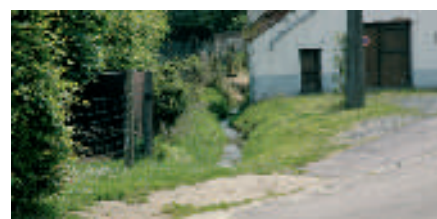
Le Ry de Beurieux

L'ensemble de ces informations a été récolté à l'initiative du Contrat de rivière Dyle et affluents auprès de nombreux partenaires. Le Contrat de rivière les en remercie vivement.