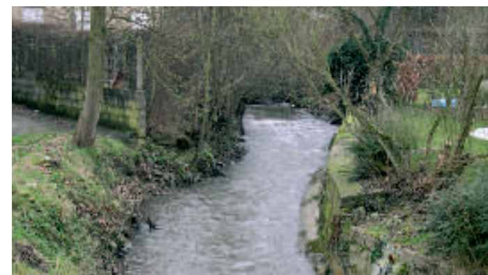
L'Orne à Mont-Saint-Guibert

Des feuillets d'information concernant les rièrres environnantes (Orne amont, Thyle, Dyle, Houssière et Nil) sont également disponibles sur simple demande au Contrat de rivière Dyle et affluents (010 62 10 53).