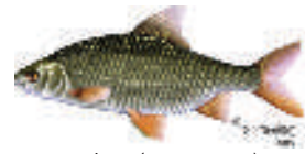
Le gardon (20-35 cm)

À Mont-Saint-Guibert, on dénombre 5 espèces de poissons dans l'Orne : une majorité de gardons et d' épinoches ainsi qu'un certain nombre de goujons , loches franches et rotengles . Par ailleurs, la société de pêche locale déverse régulièrement des truites dans la rivière. Autrefois, les eaux de l'Orne comptaient une grande population de truites fario . Dans le lit de la rivière, on pouvait également dénicher des chabots , poissons devenus très rares aujourd'hui et dont l'absence confirme l'état de détérioration du cours d'eau.