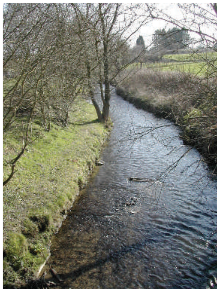
L'Orne à Beurieux

La vallée de l'Orne, entre Mont-Saint-Guibert et Court-Saint-Étienne, c'est aussi :