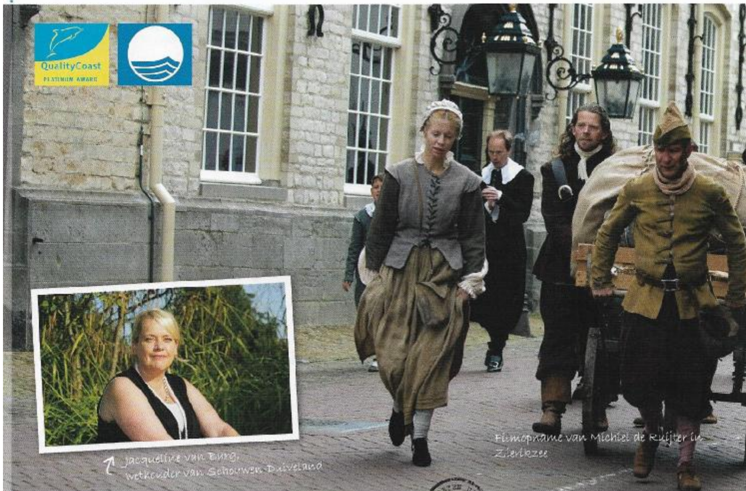
Filmopname van Michiel de Ruijter in Zierikzee